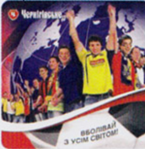
UA-Чернигов 1 A