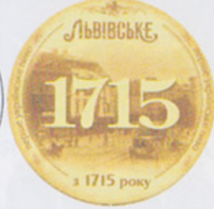
UA-Львов (Львовская пивоварня) A