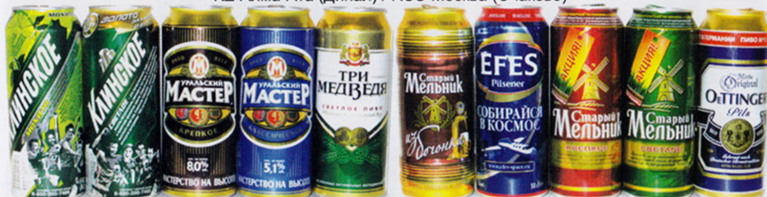
RUS-Клин х2 / RUS-Челябинск х2 / RUS-Калининград / RUS-Москва (Эфес) х4 / RUS-Мытищи