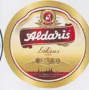
RUS-Рига (Aldaris) А