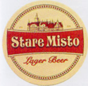
UA-Львов (Перша приватна) 1