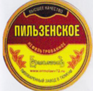
RUS-Тюмень (Ермолаев) 1