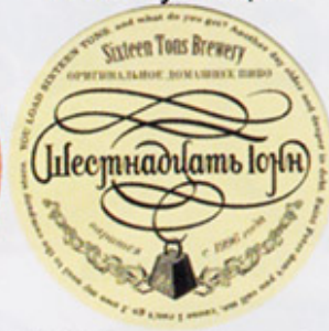
RUS-Москва (16 тонн) А