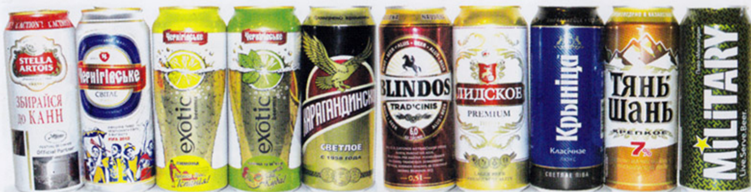
UA-Чернигов х4 / KZ-Караганда / LT-Утена / LT-Каунас (Ragutis), для ВУ / ВУ-Минск (Крыница) / KZ-Алма-Ата (Динал) / RUS-Москва (Очаково)