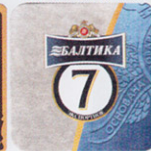
RUS-СПб (Балтика) 1