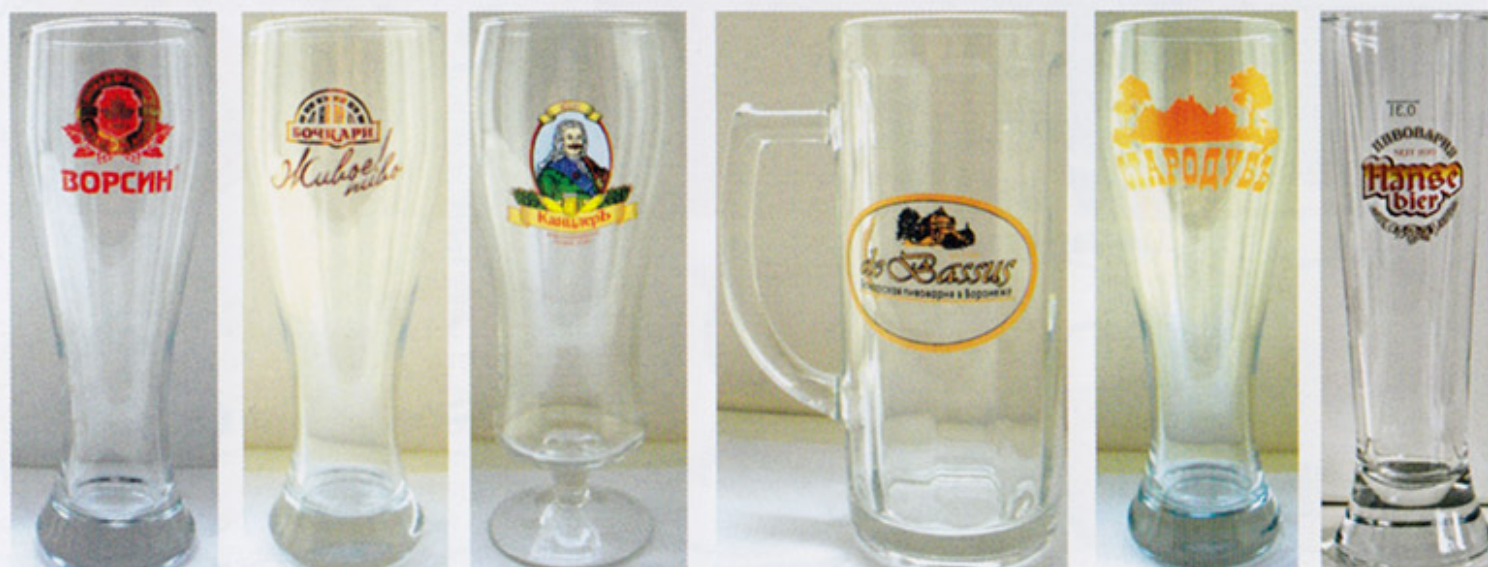
RUS-Барнаул RUS-Бочкари RUS-Воронеж (ОЧП) RUS-Воронеж (de Bassus) RUS-Ковров RUS-СПб (Hanse)

ПИВНЫЕ БАНКИ - BEER CANS - BIERDOSEN - VOITES A BIERE - LATTINE DI BIRRA - PLECHOVKY