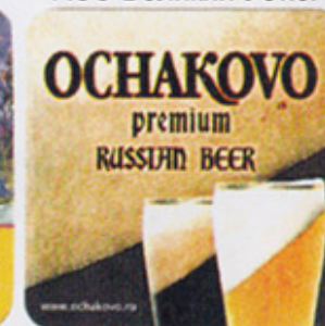
RUS-Москва (Очаково) 1 А