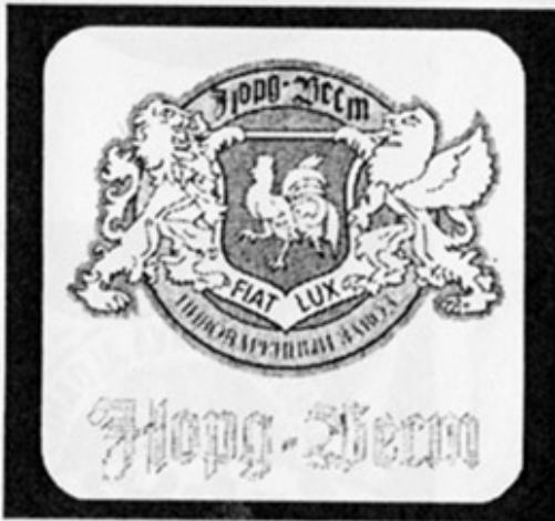
RUS - Москва