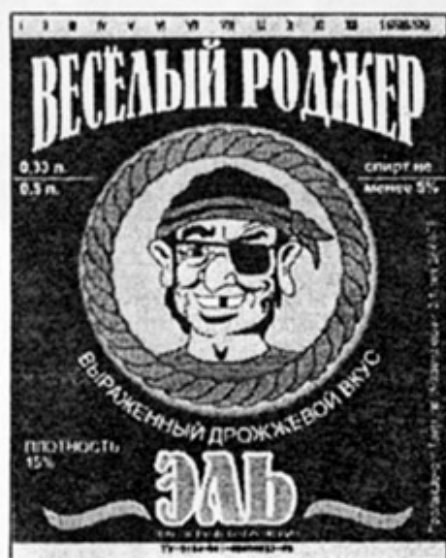
RUS - Томск