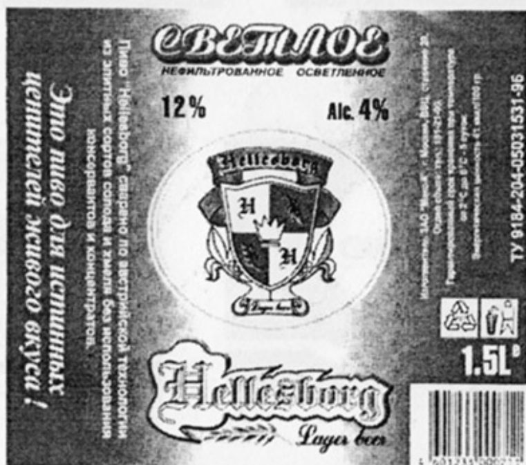
RUS - Москва