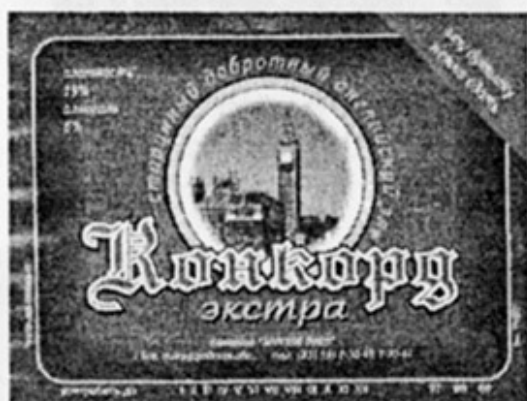
RUS - Бор, Нижегород. обл.