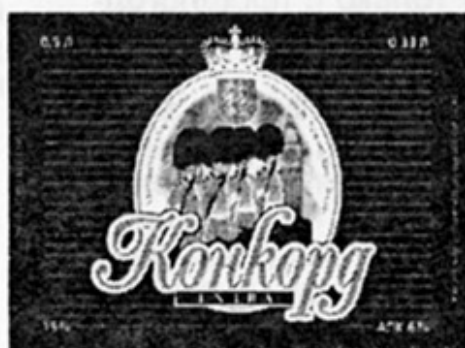
RUS - Москва