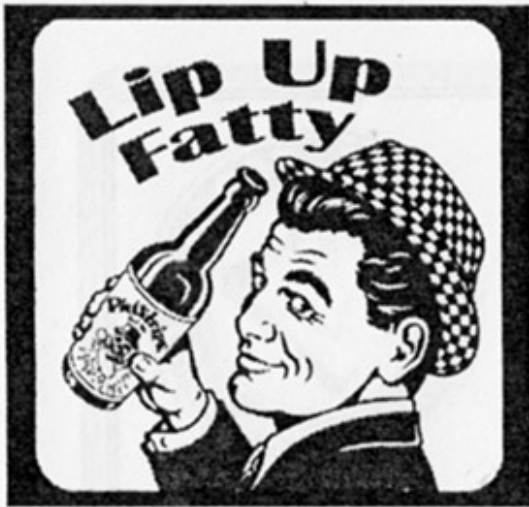
USA – Durango, CO