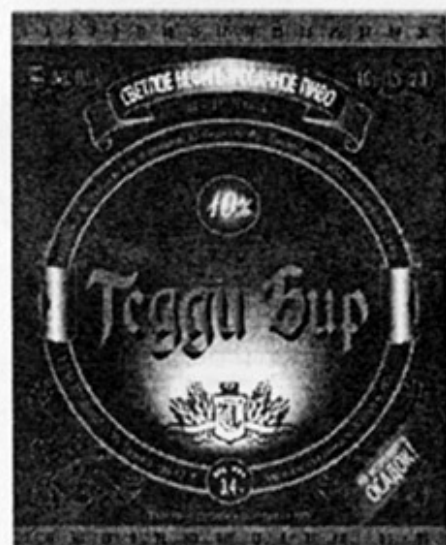
RUS - Ангарск