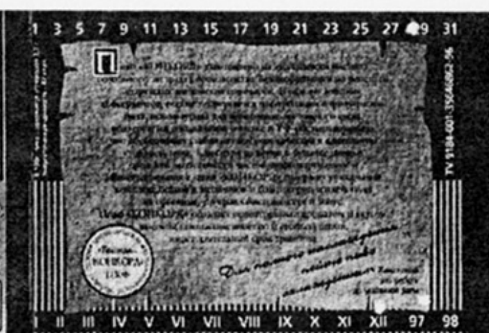
RUS - Иркутск