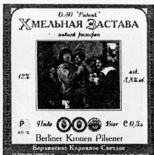
RUS - Новосибирск