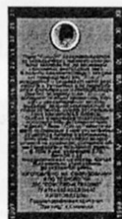
RUS - Смоленск