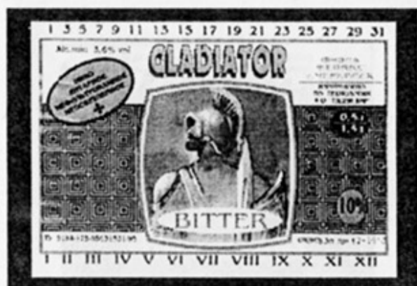
RUS - Черкесск