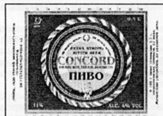
RUS – Южно-Сахалинск