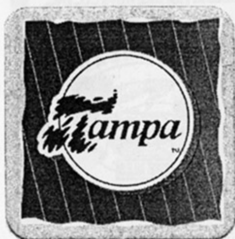
RUS - Екатеринбург