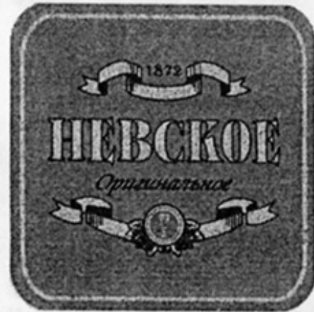
RUS – Санкт-Петербург