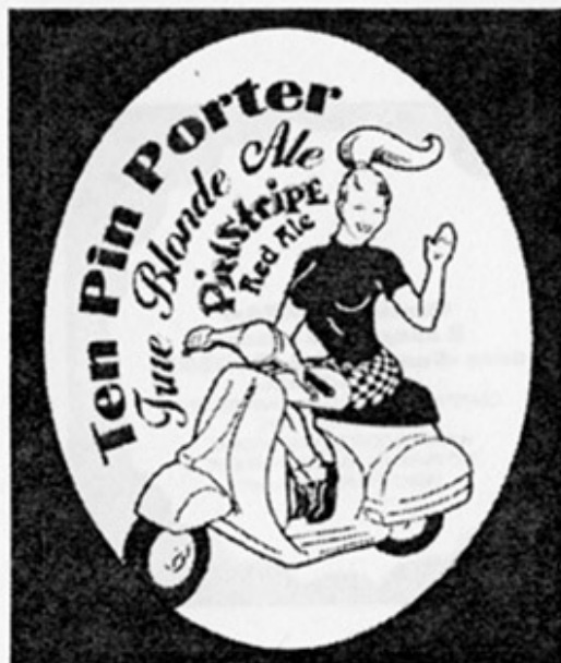
USA – Durango, CO