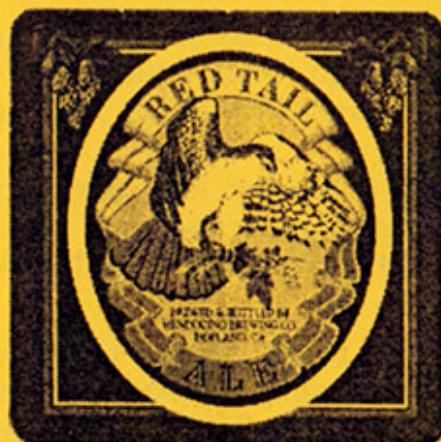
USA – Hopland, CA