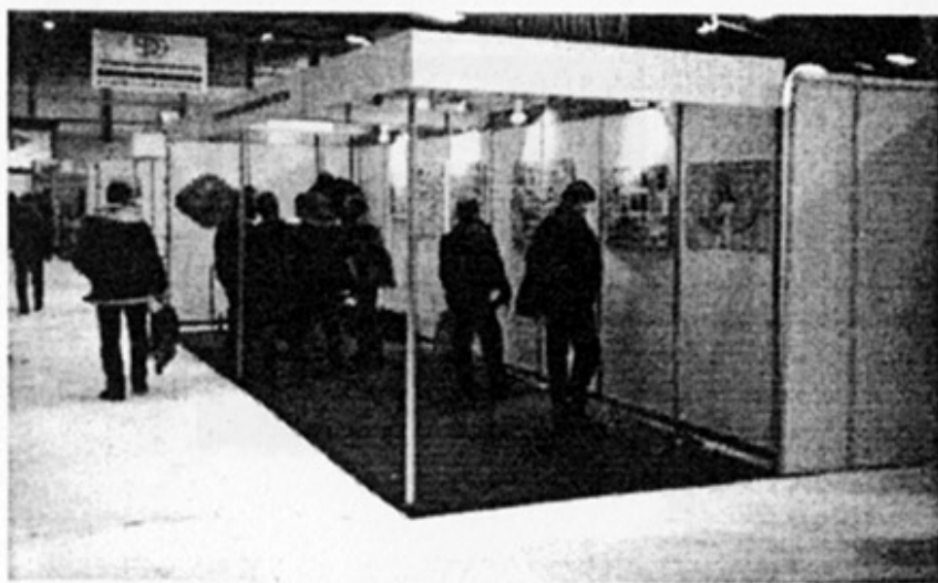
Стенд МККПА на выставке «Этикетка-99»

были вывешены листы с образцами пивных этикеток. Поскольку, среди коллекционеров, Южная Корея относится к ряду стран так называемой «высокой экзотики», этикетки «пасли» всю выставку. Каково же было наше разочарование, когда при ближайшем рассмотрении они оказались вовсе не корейскими, а китайскими. Подвела таки схожесть иероглифов.