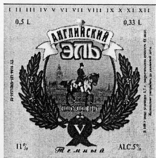
RUS – Москва