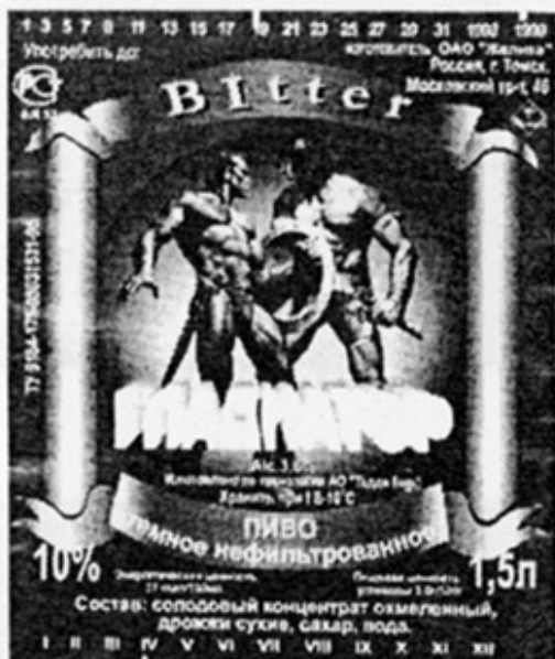
RUS – Томск