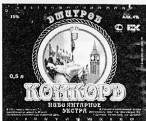
RUS - Дмитров