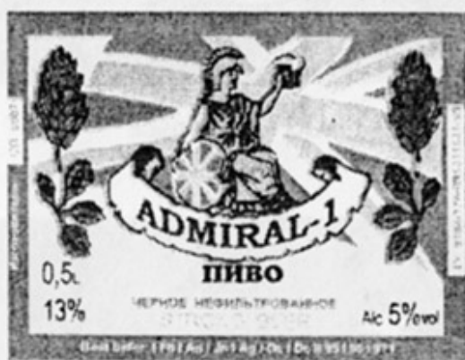
RUS - Новороссийск