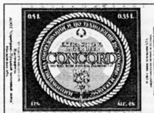
RUS – Серебряные пруды, Моск. обл.