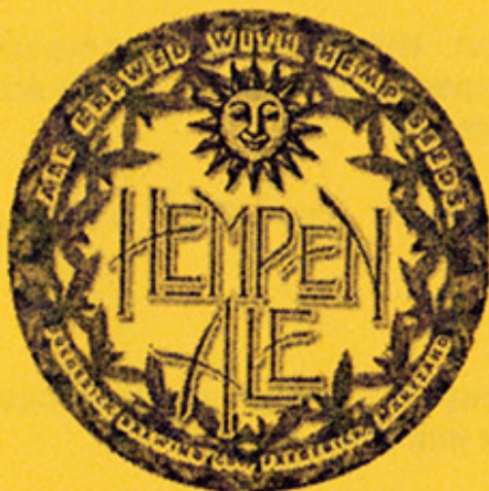
USA – Frederick, MD