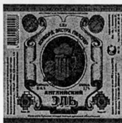
RUS - Ивантеевка, Москов. обл.