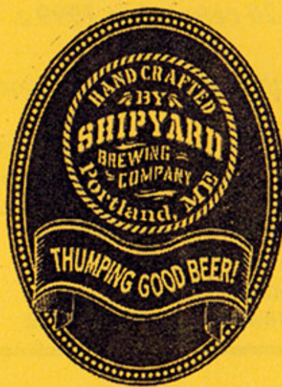
USA – Portland, ME