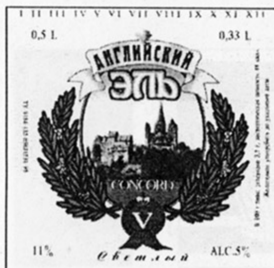
RUS – Москва