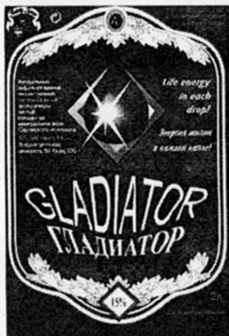
RUS – Коренево, Москов. обл.