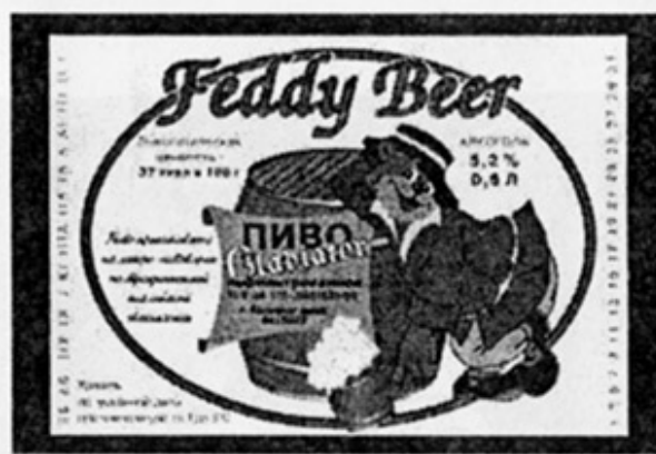
RUS - Таганрог