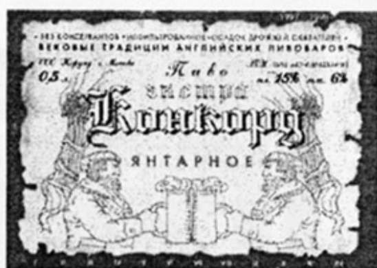
RUS - Москва