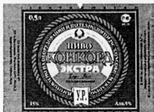
RUS – Балезино, Удмуртия