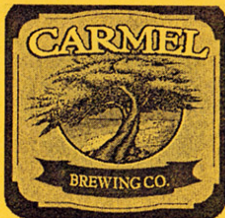
USA – Salinas, CA