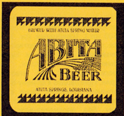
USA – Abita Springs, LA