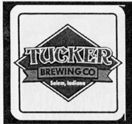
USA – Salem, IN