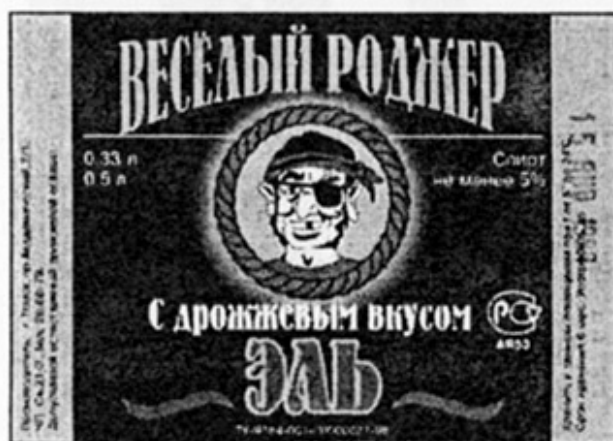
RUS - Томск