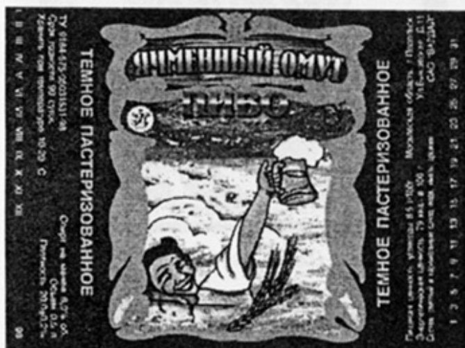
RUS - Подольск