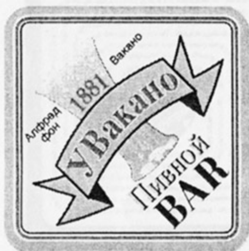
RUS - Самара