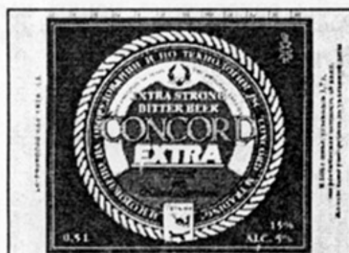
RUS – Тотма, Вологодская обл.