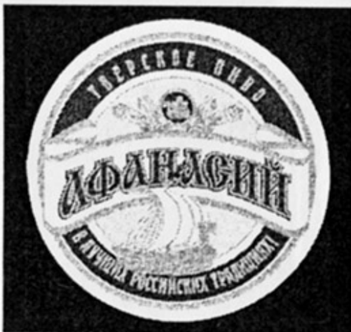
RUS - Тверь