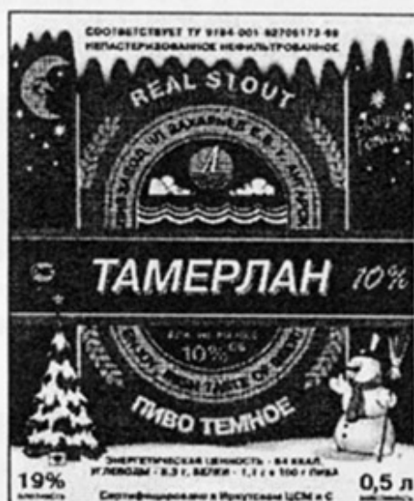
RUS - Ангарск