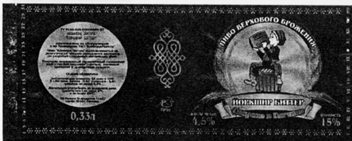
RUS - Гатчина, Ленинград. обл.