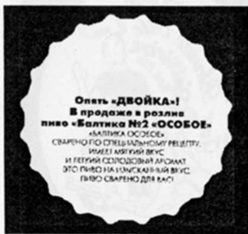
RUS - Санкт-Петербург