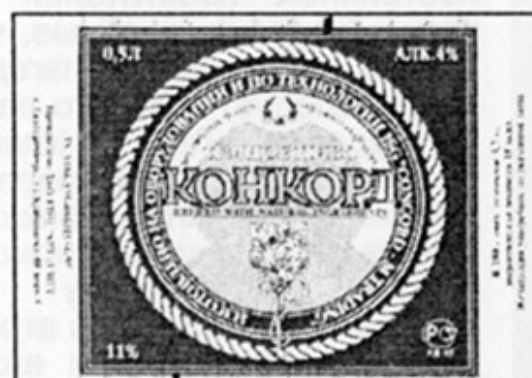
RUS – Екатеринбург