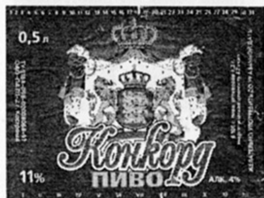
RUS - Кострома