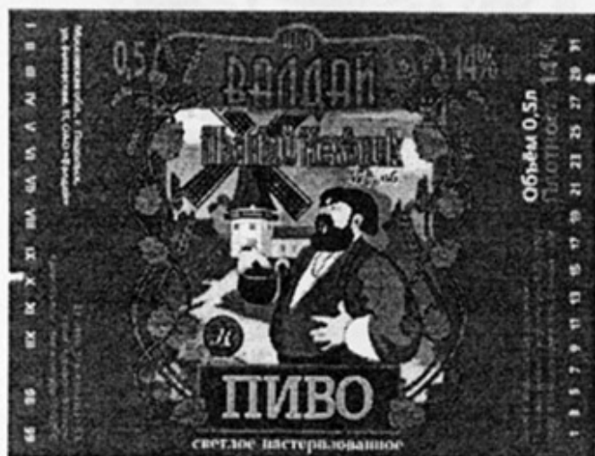
RUS - Подольск