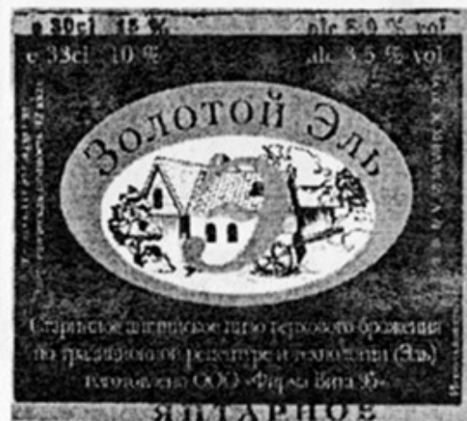
RUS - ?