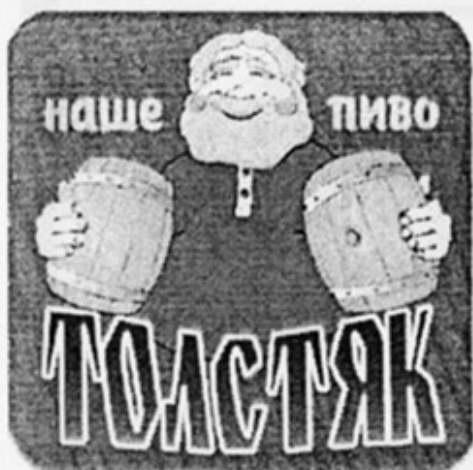
RUS - Саранск