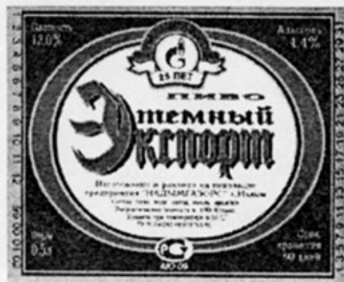
RUS - Надым, Тюмен. обл.