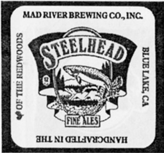
USA – Blue Lake, CA