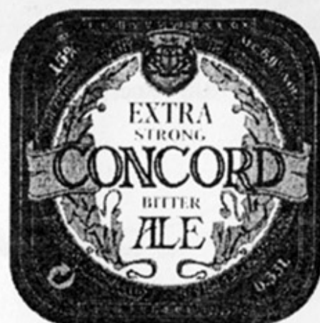
RUS - Москва