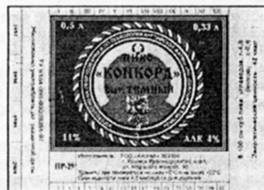
RUS – Крымск, Краснодарский кр.