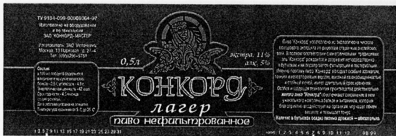
RUS - Москва