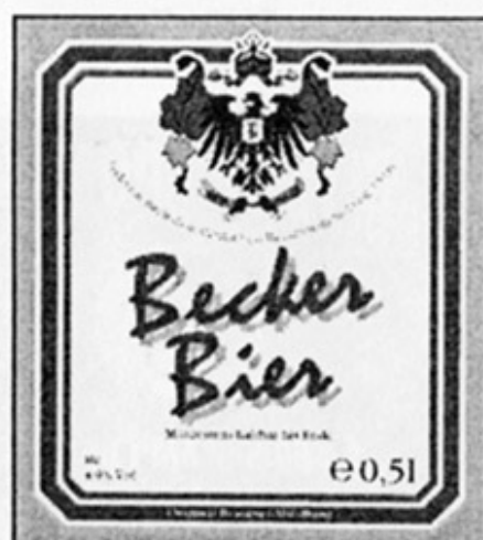
RUS - Новороссийск